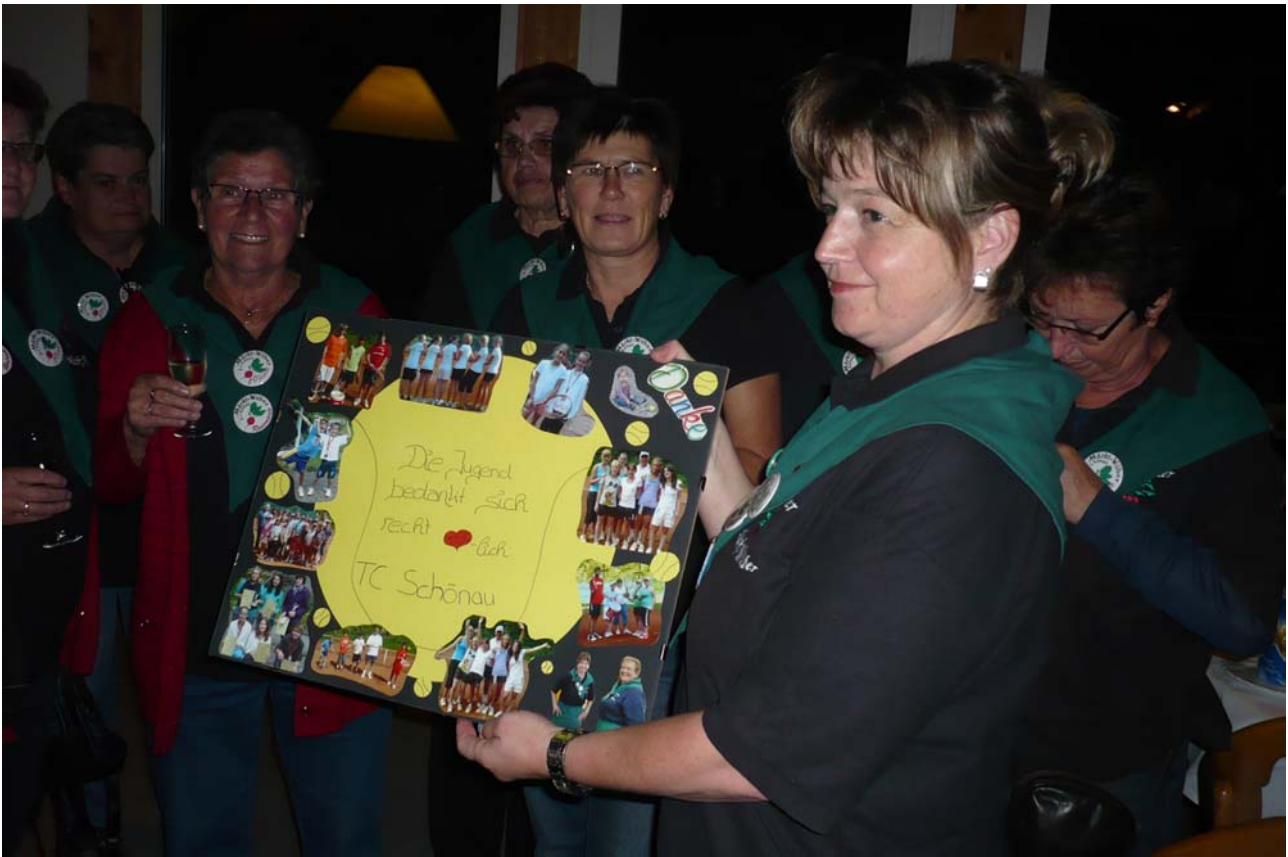
Bilder: Scheckübergabe und Plakatübergabe